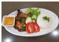
Choix supplémentaires $3.99 / Extra choice $3.99