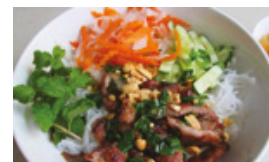
Choix supplémentaires $3.99 / Extra choice $3.99

*Tous les plats sont servis avec des arachides / All plates are served with peanuts