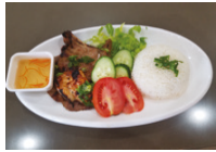
Choix supplémentaires $3.99 / Extra choice $3.99