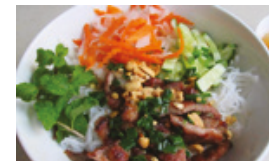
Choix supplémentaires $3.99 / Extra choice $3.99

*Tous les plats sont servis avec des arachides / All plates are served with peanuts